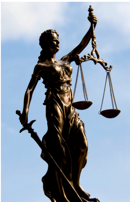
Beschlussvorschläge der Hauptversammlung sollten routinemäßig mit der Entsprechenserklärung nach § 161 AktG abgeglichen werden

Die Entscheidung des BGH gibt erste Leitlinien für die Anordnung von Beschränkungen des Rede- und Fragerechts in der Satzung sowie im konkreten Einzelfall. Im Detail muss der Versammlungsleiter aber immer die konkrete Situation im Auge haben. Der Entscheidung des BGH werden sicher noch viele weitere folgen.