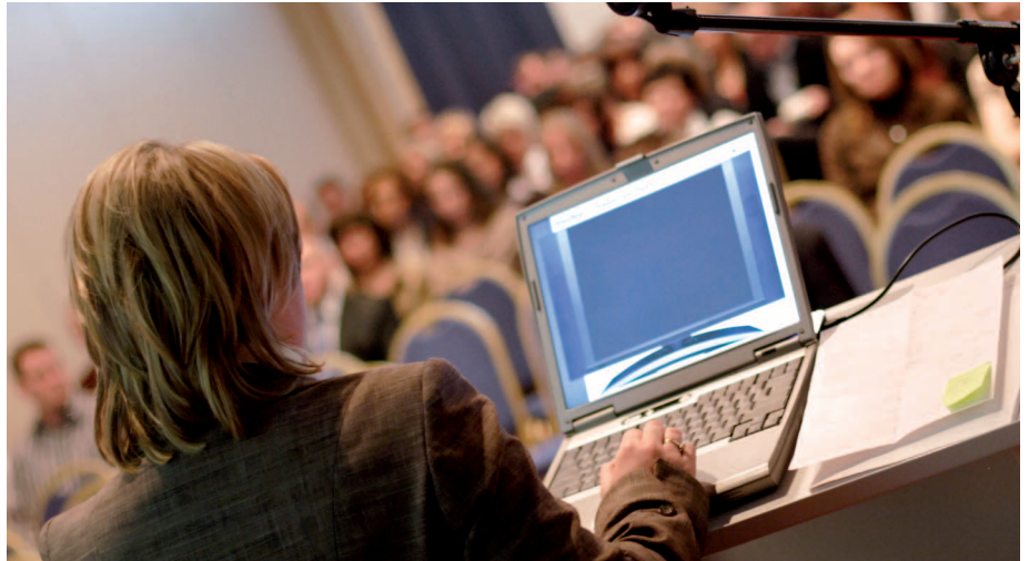
Der BGH gibt erste Leitlinien für die Anordnung von Beschränkungen des Rede- und Fragerechts. In der konkreten Situation liegt es jedoch am Versammlungsleiter die Situation im Auge zu behalten.

Das Verhältnis zwischen Deutschem Corporate Governance Kodex (DCGK), Entsprechenserklärung nach § 161 AktG und Hauptversammlungsbeschlüssen hat auch nach der Entscheidung des BGH aus dem vergangenen Jahr 2009 die Gerichte beschäftigt. Hervorzuheben ist dabei die Entscheidung des LG Hannover, die sich mit der Wahl eines Aufsichtsratsmitglieds befasste, bei dem aufgrund der laufenden gesellschaftsrechtlichen Beratung eines Gesellschafters die Gefahr dauerhafter Interessenkollisionen drohte.